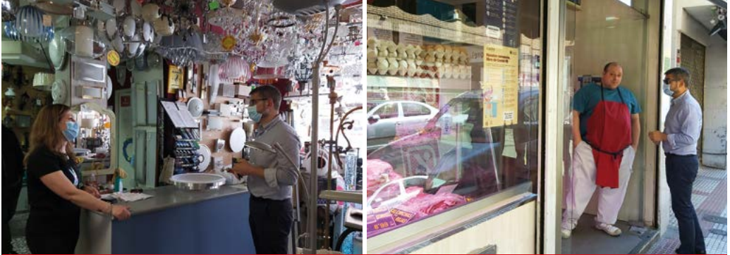
El alcalde, en una visita al Distrito Centro, se ha interesado por la adaptación de varios comercios locales a las nuevas medidas

La lucha contra la pandemia del Covid-19 ha obligado a los comercios a mantener sus puertas cerradas al público durante casi dos meses. Desde el inicio de la `desescalada`, pueden volver a abrir, pero con medidas de seguridad y restricciones.