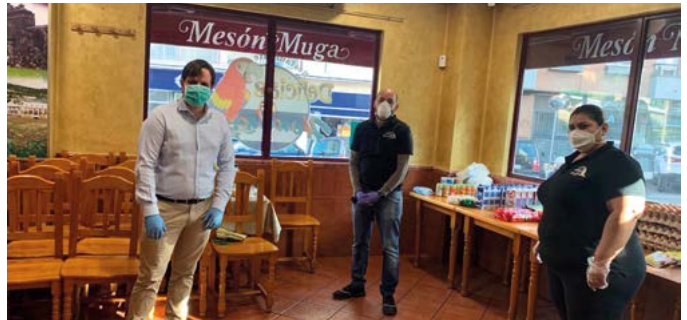
Bar Honduras de la calle Guadiana ha sido receptor de donaciones de alimentos que luego han repartido entre las familias