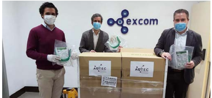
Donación de mascarillas de AOTEC, la Asociación Nacional de Operadores de Telecomunicaciones y Servicios de Internet