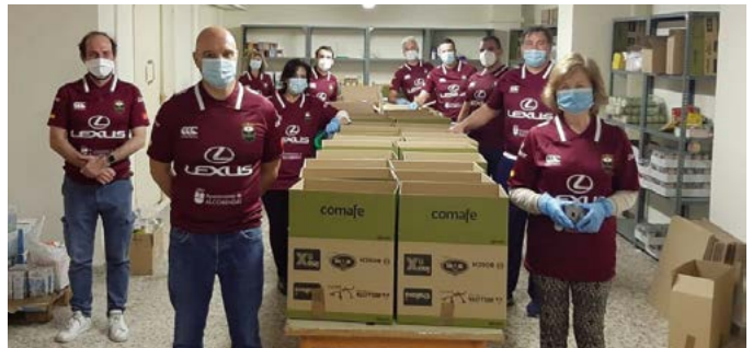
Voluntarios del Club de Rugby de Alcobendas han colaborado con el programa municipal "Llenamos tu despensa", organizando los lotes que reciben las familias más vulnerables