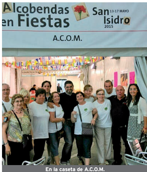
En la caseta de A.C.O.M.