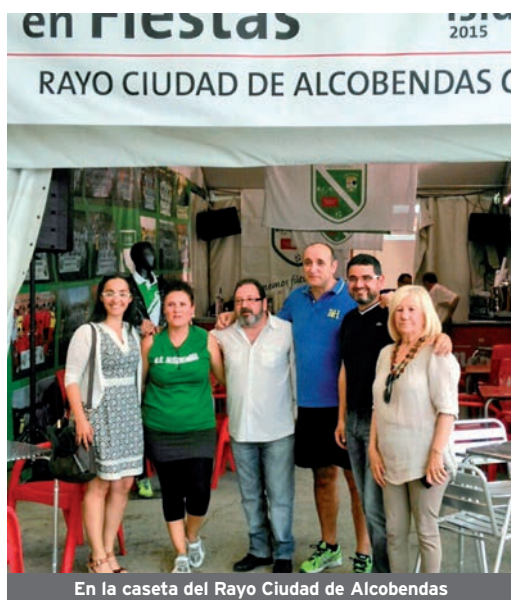
En la caseta del Rayo Ciudad de Alcobendas