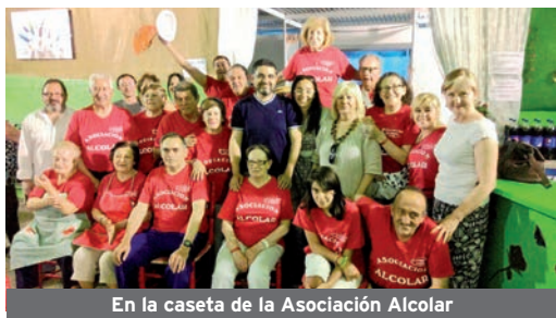
En la caseta de la Asociación Alcolar