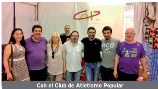
Con el Club de Atletismo Popular