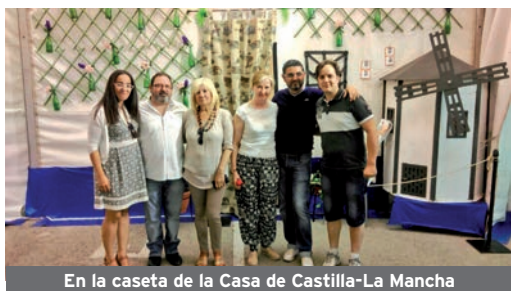
En la caseta de la Casa de Castilla-La Mancha