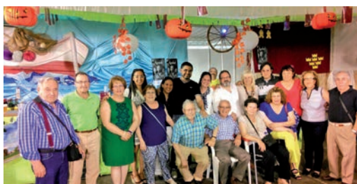
En la caseta de la Casa Regional de Murcia