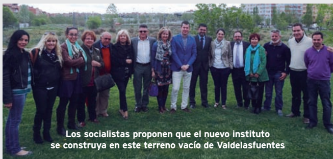
Los socialistas proponen que el nuevo instituto se construya en este terreno vacío de Valdeasfuentes