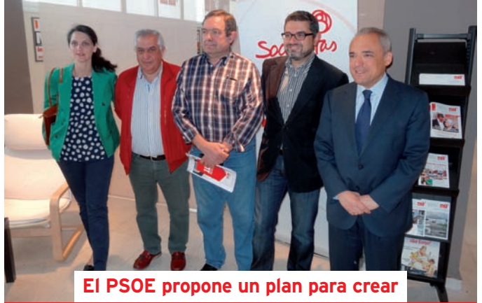
El PSOE propone un plan para crear

El candidato a la Alcaldía se compromete en este sentido a llevar a la práctica desde el Ayuntamiento un Plan de Empleo orientado a los colectivos más vulnerables , sobre todo los mayores de 45 años, mediante la recuperación del tejido empresarial de la ciudad y la atracción de empresas al Parque Empresarial de Valdelacasa, un plan de choque para salvar al pequeño y mediano comercio y el fomento del autoempleo.