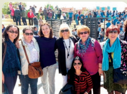
Candidatas del PSOE de Alcobendas en el acto público por la Igualdad