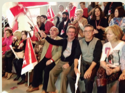
Militantes socialistas de Alcobendas en la Conferencia Municipal