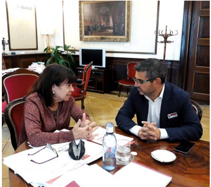
El encuentro entre ambos dirigentes socialistas tuvo lugar en la Cámara Alta

En este sentido, Cristina Narbona, ha puesto sobre la mesa la necesidad de “dar una respuesta a los movimientos en defensa del medioambiente que está liderando la juventud”. El cambio climático “es