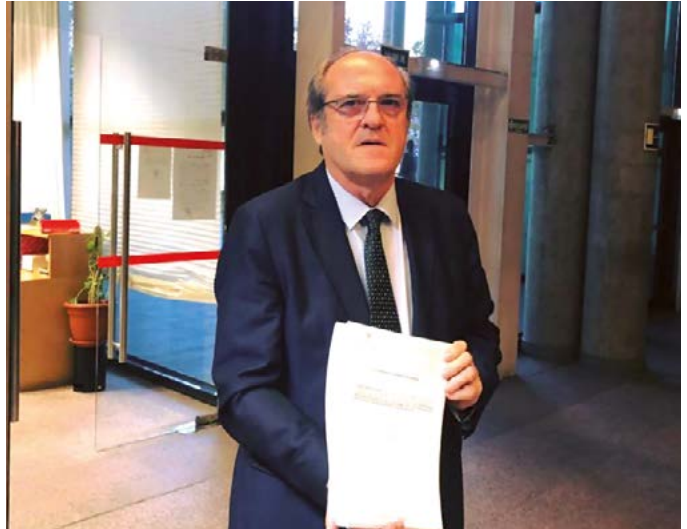
El portavoz del PSOE en la Asamblea de Madrid y candidato a la presidencia de la región, Ángel Gabilondo, muestra el documento con las enmiendas

Las áreas de sanidad y educación concentran el mayor volumen e importe económico de las enmiendas. En concreto, los socialistas han reservado una partida de 44,5 millones de euros para la construcción de nuevos centros de salud y renovación de mobiliario;