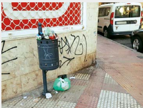
Calle Pablo Picasso