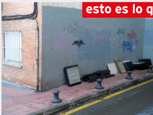
Calle Obispo Eijo de Garay

Un día cualquiera paseando por Alcobendas, durante la legislatura del señor García de Vinuesa, esto es lo que se padece