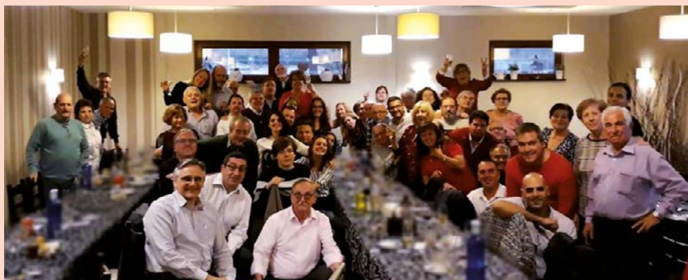
Encuentro navideño de la Agrupación Socialista