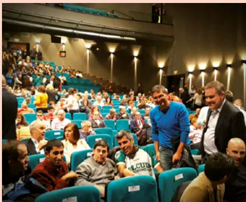
Con los deportistas y clubes de nuestra ciudad