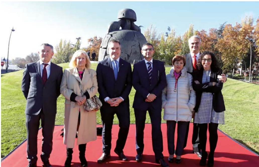
El Grupo Municipal Socialista de Alcobendas en la celebración del 40 aniversario de la Constitución Española