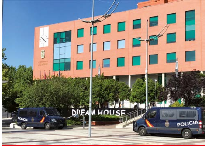
Furgones policiales frente al Ayuntamiento el pasado 3 de julio