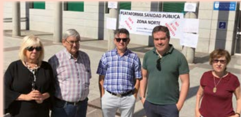
En defensa de la sanidad pública, con el Blas de Otero debe recuperarse para la atención sanitaria de Alcobendas