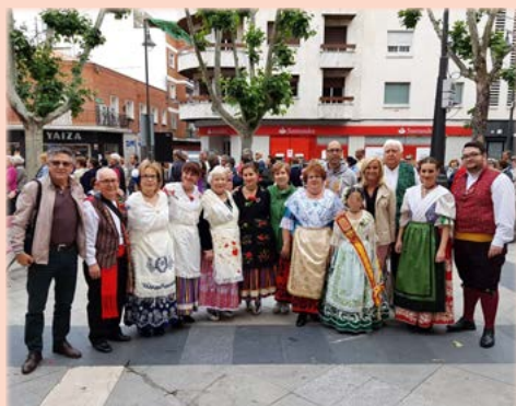
Celebrando el Día de Murcia con la casa regional