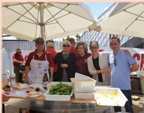
Compartiendo migas con la Casa de Castilla-La Mancha