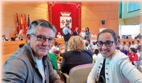
Por el juego limpio en el deporte