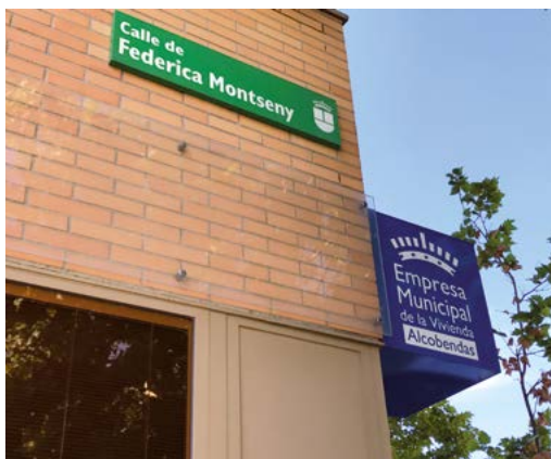
En el Distrito Norte de Alcobendas solamente hay siete calles con nombres de mujer. Las calles Dolores Ibaruri y Federica Montseny son dos ejemplos.