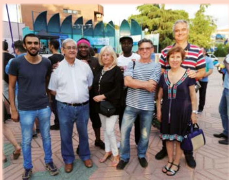
Con los refugiados del Centro de Acogida de Alcobendas