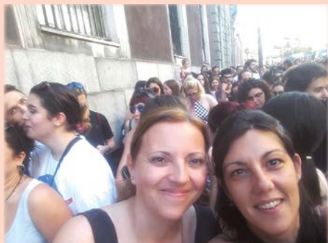
Protestando contra la puesta en libertad de 'La Manada'