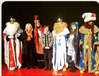
Recibiendo a los Reyes Magos

31 ACTO EN RECUERDO DE LAS VÍCTIMAS DEL HOLOCAUSTO