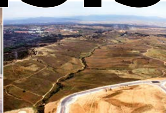
Los planes de urbanismo hundidos