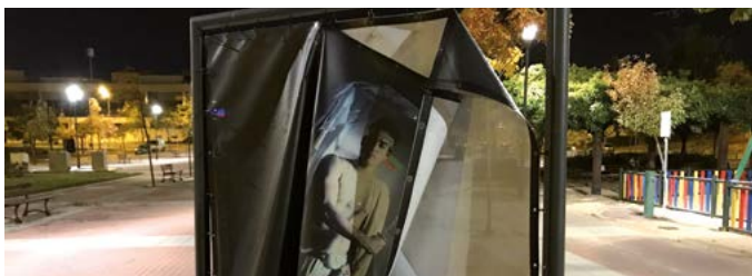
Vandalismo en la exposición de fotos en el Paseo de Valdela Fuentes