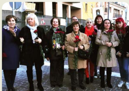
En las fiestas de la Virgen de la Paz