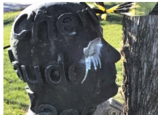
Parque de Fuentelucha