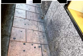
Suciedad en las calles