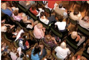
La Participación Ciudadana paralizada