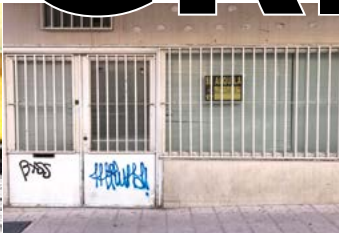
Los pequeños negocios están cerrando