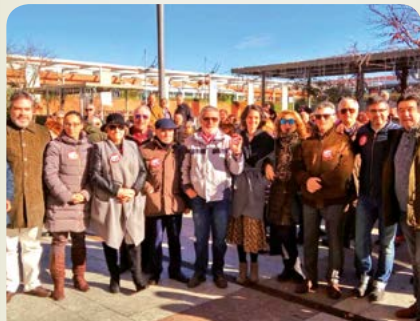
Defendiendo las pensiones dignas