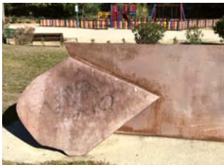
Parque de Andalucía