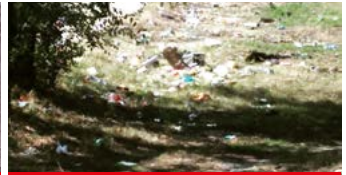
Vertedero en el Arroyo de la Vega