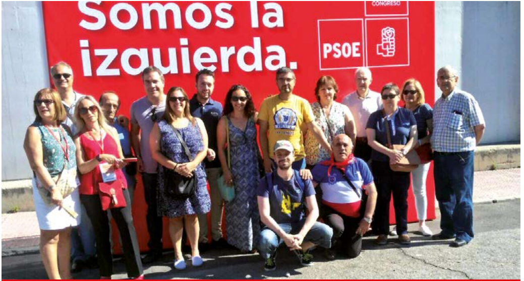
Los socialistas de Alcobendas en el 39 Congreso federal del PSOE

El pasado 25 de julio el Comité Regional del PSOE de la Comunidad de Madrid aprobó el calendario para elegir a su nueva dirección. Habrá un proceso de primarias para elegir al secretario o secretaria general, un proceso que se celebrará a dos vueltas: la primera el 30 de septiembre, y si ninguno de los candidatos o candidatas superase el 50% de los votos, una segunda votación entre los dos más votados el 7 de octubre. El proceso culminará en la celebración del 13er Congreso Regional del PSOE-M que se celebrará los días 20, 21 y 22 de octubre.