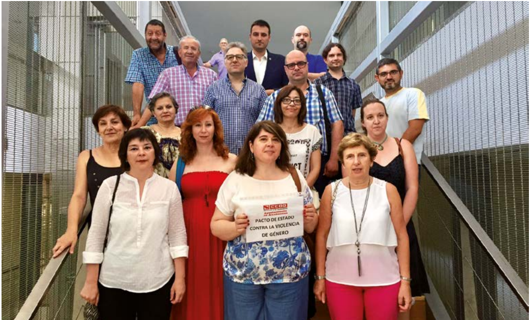
La izquierda de Alcobendas se une contra la violencia machista

A propuesta de CCOO, los partidos políticos PSOE, Sí Se Puede, UPYD e IU defendieron una Moción que fue debatida en el Pleno Municipal del pasado 27 de junio y que tenía como objetivo implementar medidas concretas para promover la igualdad y acabar con la lacra de la violencia machista.