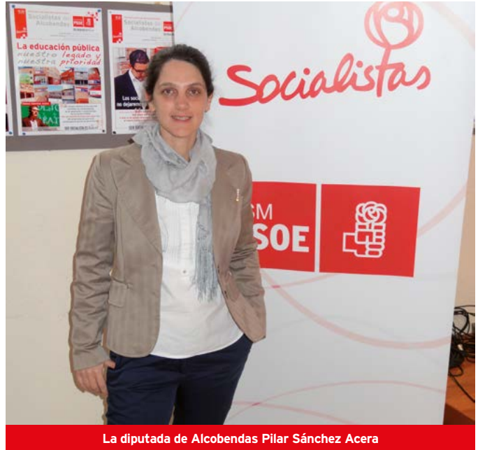
La diputada de Alcobendas Pilar Sánchez Acera

Por ejemplo, sobre el estado del Centro de Salud del Arroyo de la Vega; una pregunta sobre la negativa del Gobierno regional de estudiar la posibilidad de un abono transporte único para Alcobendas y San Sebastián de los Reyes; una enmienda para incluir en los presupuestos regionales la construcción de un nuevo instituto público ; así como una pregunta de control sobre las inversiones del Plan Prisma que han revelado cómo dos obras por valor de 8,2 millones de euros fueron frenadas por Vinuesa.