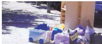
Electrodomésticos y muebles pasan días en las calles