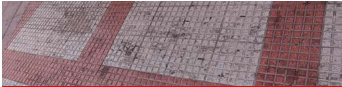
Aceras sucias y pringosas en casi toda la ciudad