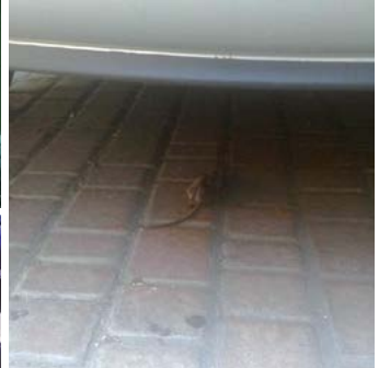
Ratas en las calles