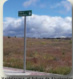
Valdelacasa, el futuro de Alcobendas, es un erial