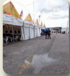
El recinto ferial abandonado en San Isidro