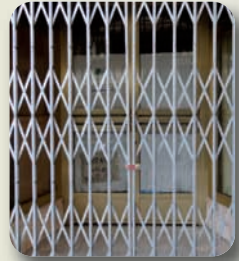
Uno de cada tres comercios ha cerrado