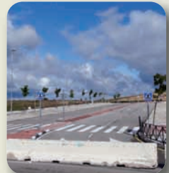
Este parque empresarial ha sido inaugurado hasta 6 veces