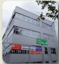
Las empresas abandonan el polígono industrial